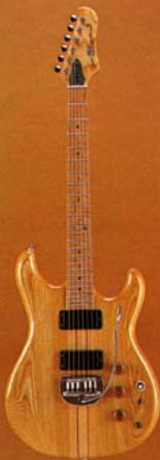
GO II 700NT/M

GO II 700仕様：ボディ/セミアカセ、ネック/メイプル+マホガニー・スピードウェイ 指板/メイプルまたはローズ 糸巻/SD81-66M ピックアップ/ハムバッキングx2 トレモロユニット付またはテンションアジャスター付カラー：GO II 700NT、GO II 700DST、GO II 700RT、GO II 700N、GO II 700DS、GO II 700R。 注：NT=ナチュラル・トレモロ付 DST=ダークステイン・トレモロ付 RT=レッドサン/ースト・トレモロ付のことです。