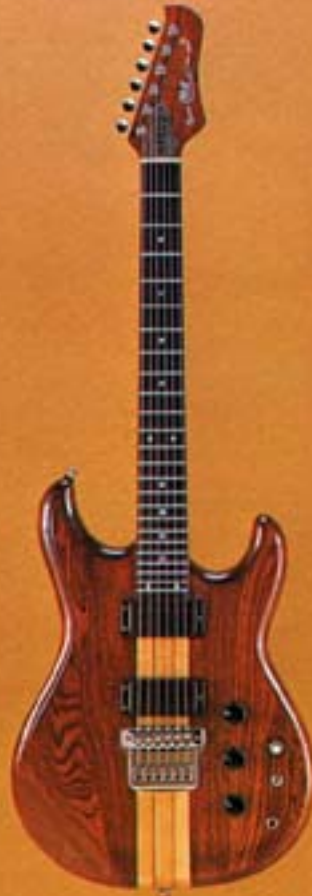
GO II 700DS/R