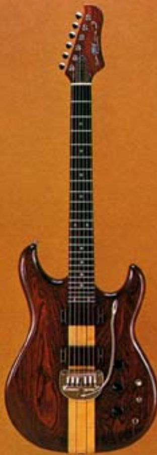
GO II 700DST/R