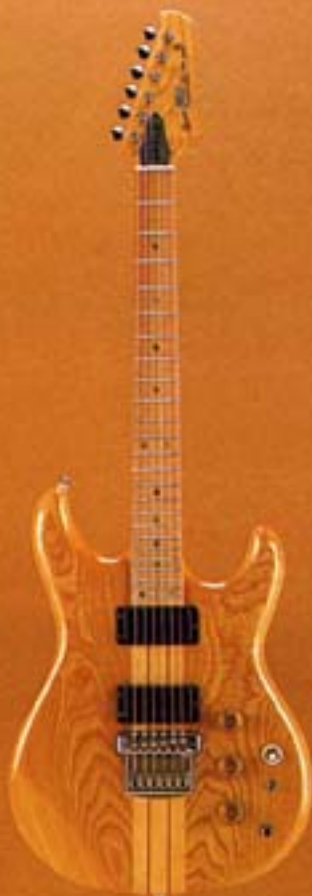
GO II 700N/M