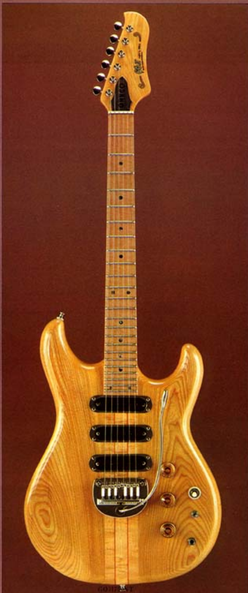
GO II 750 NT

注: NT=ナチュラル・トレモロ付 DST=ダークステイン・トレモロ付 RT=レッドサンバースト・トレモロ付のことで、